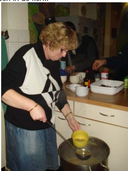
Hier word de soep uitgedeeld door een medewerkster van "Het Kruispunt".

Ik vond het een erg leuke stage en ik zal zeker actief blijven helpen in de kerk!